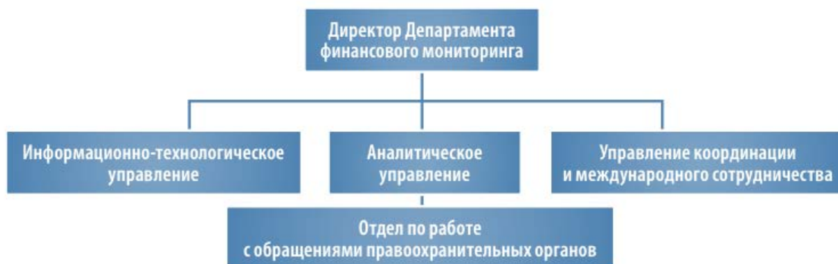
Рис. 1. Структура ДФМ

Аналитическое управление принимает меры по предотвращению легализации доходов, полученных преступным путем, выявляет финансовые операции, которые могут быть связаны с получением преступных доходов и их легализацией.