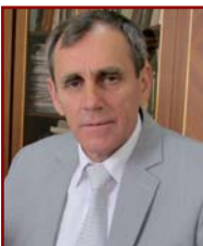
ЦЫДИК Владислав Станиславович, председатель Комитета государственного контроля Минской области