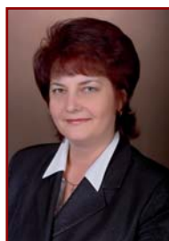
НАУМЧИК Алла Александровна, ректор Белорусского торгово-экономи- ческого университета потребительской кооперации, член Постоянной комис- сии Совета Республики Национального собрания по международным делам и национальной безопасности