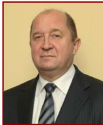
ЯКОБСОН Александр Серафимович, Председатель Комитета государственного контроля Республики Беларусь, председатель редакционного совета