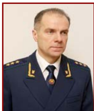
ВАСИЛЕВИЧ Григорий Алексеевич, Генеральный прокурор Республики Беларусь, доктор юридических наук, профессор