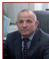
СОЦ Семен Павлович, директор РУП «Служба ведомственного контроля при Министерстве архитектуры и строительства»