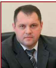
МАКСИМЕНКО Александр Владимирович, директор Департамента финансового мониторинга Комитета государственного контроля